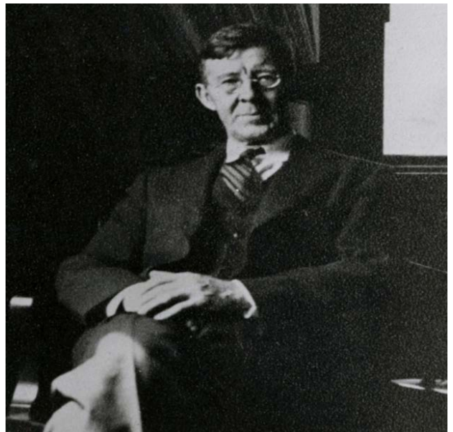
Рисунок 1. П.А. Сорокин

23 сентября 1922 года поездом Москва — Рига отправилась крупная партия «инакомыслящих» в изгнание, в числе которых был и П.А. Сорокин — выдающийся русский философ. Пароходы и поезда, на которых эмигрировала русская интел-