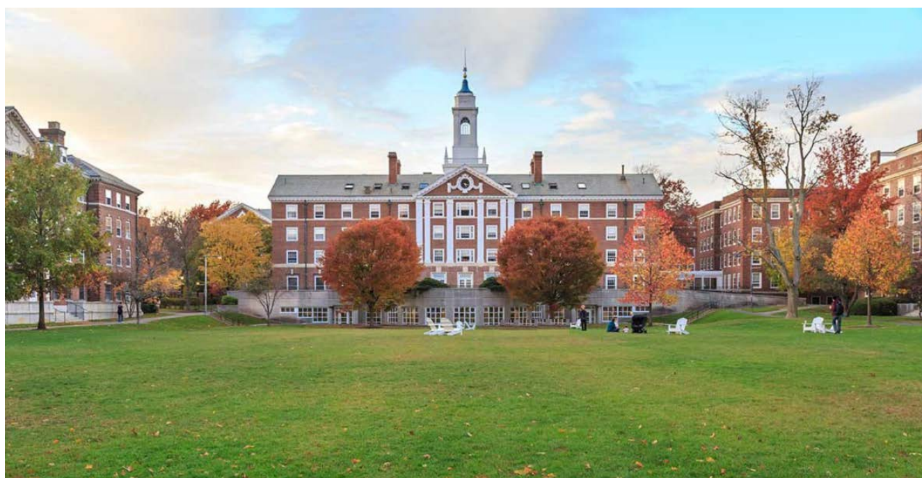
Рисунок 3. Гарвардский университет

казался делить общество на классы, а ввёл такое понятие как «страты» («слои»). В Советском Союзе, где царила пропаганда равенства всех, независимо от статуса, его теория была неприемлема. Всё население делилось на два класса — рабочих и крестьян. Интеллигенция вообще считалась